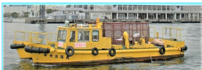
船名 第七清海丸 トン数17.9トン 昭和55年3月竣工 長さ10.9m 幅6.4m 深さ1.6m 馬力150ps×2基