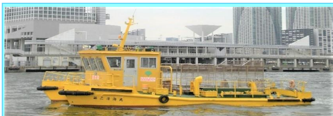
船名 第二清海丸 トン数14.0トン 平成12年3月竣工 長さ12.5m 幅6.6m 深さ1.7m 馬力230ps×2基