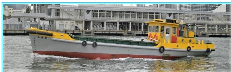
船名 清海丸 トン数 30トン 昭和60年3月竣工 長さ20.3m 幅5.0m 深さ2.1m 馬力105ps ◎集積ゴミを埋立処分地に運搬する船◎