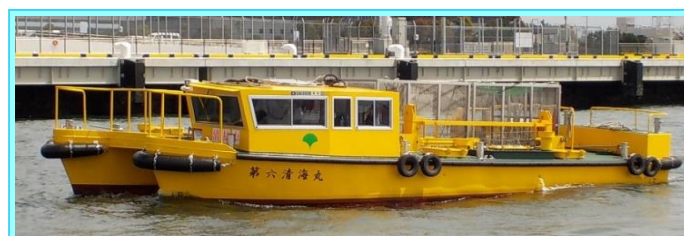
船名 第六清海丸 トン数9.1トン 令和4年3月竣工 長さ10.9m 幅6.4m 深さ1.7m 馬力174ps×2基