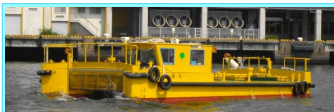
船名 第三清海丸 トン数6.6トン 平成28年3月竣工 長さ10.7m 幅5.1m 深さ1.7m 馬力182ps×2基