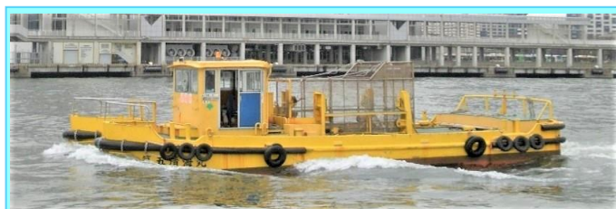
船名 第五清海丸 トン数15.6トン 昭和54年12月竣工 長さ11.2m 幅5.5m 深さ1.7m 馬力230ps×2基