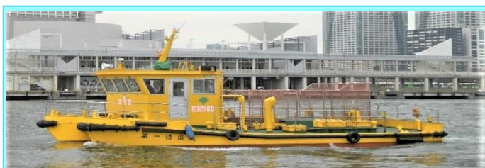
船名 第一清海丸 トン数14.0トン 平成10年3月竣工 長さ12.0m 幅6.6m 深さ1.7m 馬力230ps×2基